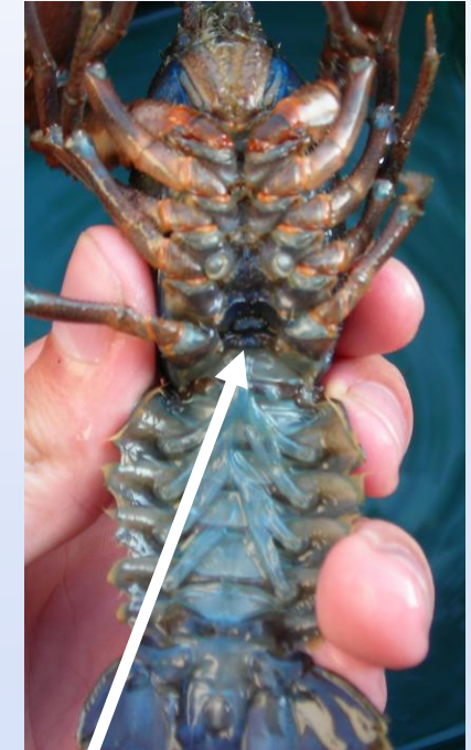
Männliche (Gonopoden) und weibliche (Gonoporen) Geschlechtsmerkmale