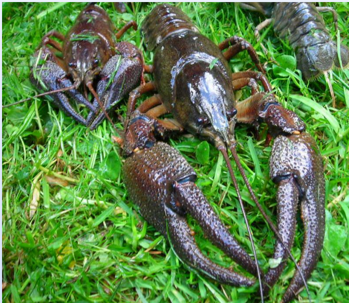
Flusskrebse müssen sich häuten, um wachsen zu können

Um wachsen zu können, müssen die Krebse ihren Panzer regelmäßig abwerfen und neu ausbilden. Der Häutungsvorgang ist für die Tiere gefährlich: